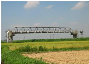
尾羽根川を横断する水管橋