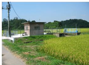
水を再利用するための施設