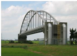
根木名川を横断する水管橋