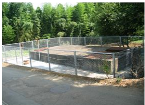
田まで流下させる水槽