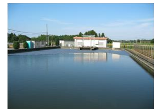
畑地かんがい用施設