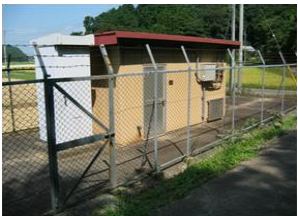
分水する施設全景