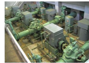
小泉揚水機場ポンプ施設