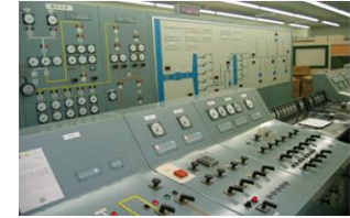
新川揚水機場操作室