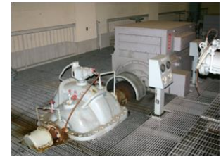
新川揚水機場ポンプ施設